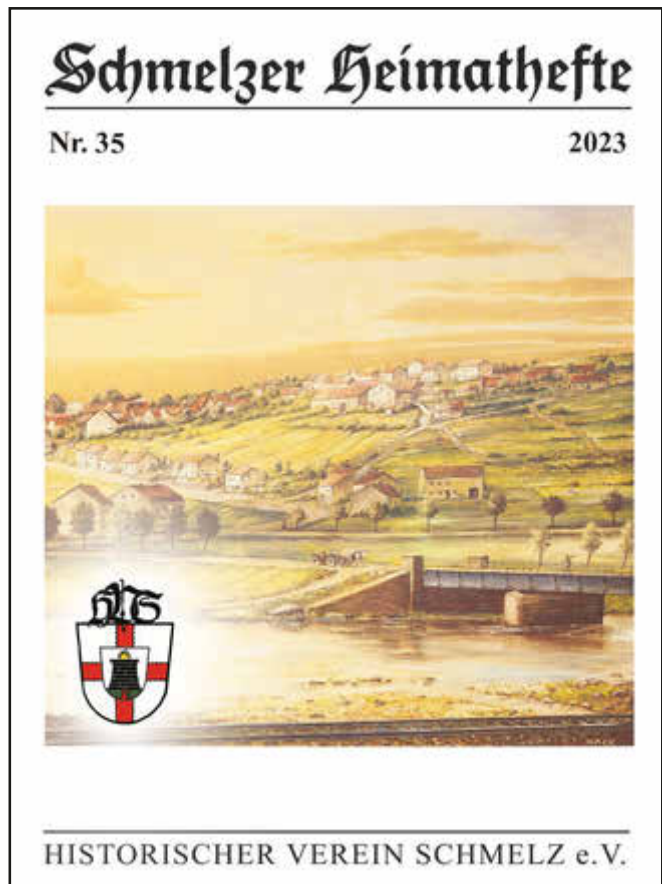
Cover des 35. Schmelzer Heimatheftes.

Ich kann Ihnen die Lektüre uneingeschränkt empfehlen! Das Heft bekommen Sie heute hier zum Sonderpreis