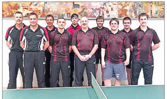
Bild aus der Saison 2012/2013, der SG Dorf/Lindscheid

Zur Saison 2010/2011 konnte der TTC Dorf wieder mit einer zweiten Mannschaft als Spielgemeinschaft mit dem TTC Lindscheid an den Start gehen. In der Saison 2011/2012 wurde der Aufstieg knapp verpasst und am Ende der 4. Platz belegt. In der Saison 2012/2013 waren die Jungs von niemandem zu bremsen und konnten souverän die Meisterschaft in der 3. Kreisklasse West ohne Punktverlust erringen. So gab es nach knapp 10 Jahren erneut eine Meisterschaft zu bejubeln.