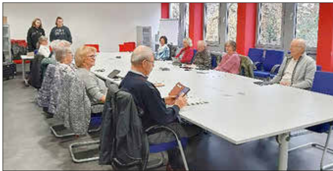
Die Teilnehmer*innen diesen Herbst mit den beiden Referentinnen von Onlinerland Saar im Sitzungssaal des Rathauses.

Fragen werden Ihnen gerne vorab beantwortet unter 06887 - 301 176 oder d.kolaric-wilhelm@schmelz.de.