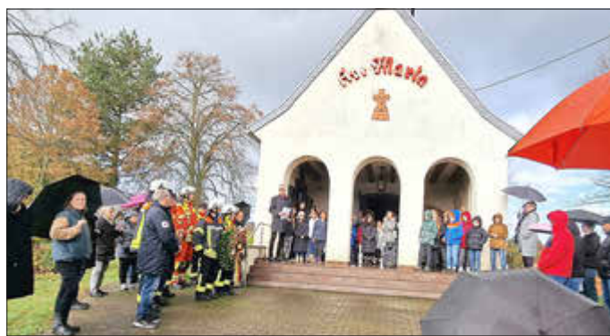
Gedenkveranstaltung am Volkstrauertag an der Hüttersdorfer Marienkapelle

Für weitere Auskünfte setzen kann man sich gerne mit Claus Jericho unter 06887/7166 oder cjl63@t-online.de in Verbindung setzen.