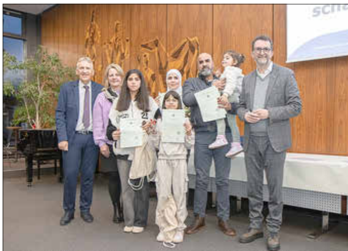
Minister Reinhold Jost, Landrat Patrik Lauer und Sandra Quinten, 1. Beigeordnete der Gemeinde Schmelz und Mitglied des saarländischen Landtages, überreichten die Einbürgerungsurkunden an die Neubürgerinnen und Neubürger im Landratsamt Saarlouis.

Seitens des Landes nahmen somit auch Minister Reinhold Jost sowie Vertreterinnen und Vertreter des Innenministeriums an der Veranstaltung teil. Traditionell waren auch die Bürgermeisterinnen und Bürgermeister der Gemeinden und Städte des Landkreises Saarlouis eingeladen, ihre Neubürgerinnen und Neubürger zu beglückwünschen. Mitglieder des hiesigen Kreistages sowie Beschäftigte der Saarlouiser Landkreisverwaltung komplettierten das Feld.