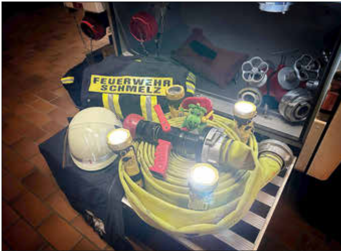
Der Löschbezirk Schmelz wünscht einen besinnlichen 3. Advent