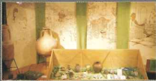
"Birg"-Ausstellung im Heimatmuseum Neipel