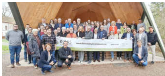
ARGE SOLAR e.V.

Weitere Informationen zum Verein unter www.argesolar-saar.de